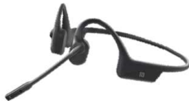
クリアトークカム

月額ランニングコスト不要で液晶画面付き子機でさ らに便利に！ナースコール、見守りセンサーとシス テム連携が可能